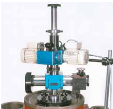
Machine de surfacage pour portée de cylindre et culasse