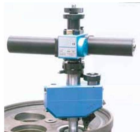
Rectifieuse de siège de soupape