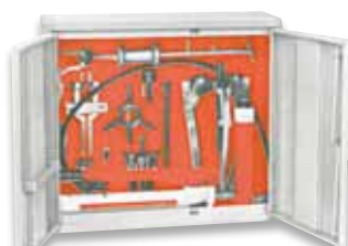
Ensemble d'extracteurs hydrauliques manuels dans un solide coffret de rangement

Nous consulter pour connaître les diverses capacités.