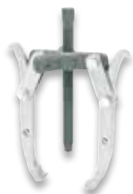
Extracteur à griffes