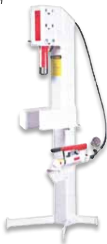
Modèle en "col de cygne" 25 tonnes